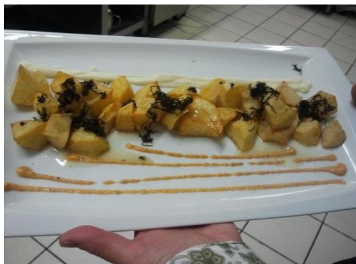
Patatas Trufa Teruel 5,50€