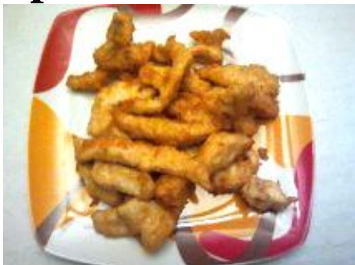
Lagrimitas de pollo 3€