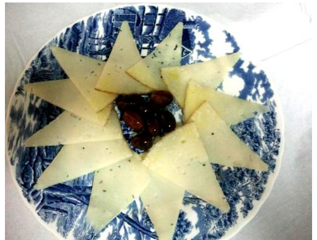
Queso de Teruel 10€