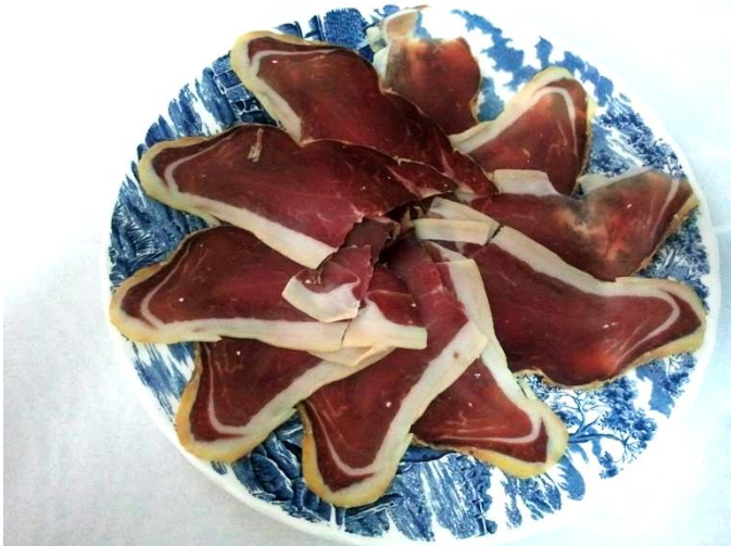
Jamón D.O. Teruel 8€