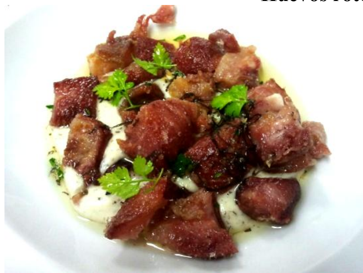
Morro de cerdo con trufa 6,50 €