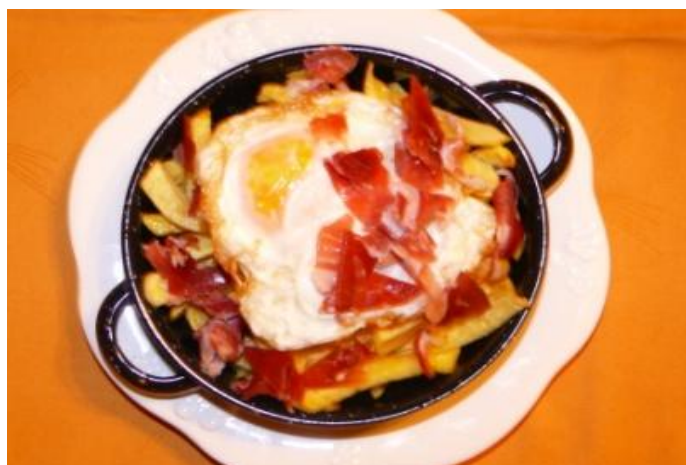
Huevos rotos con jamón 6€