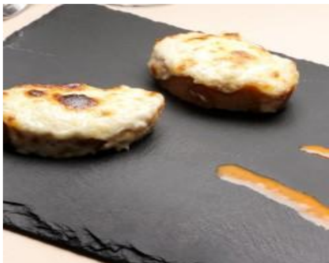
Cremoso de queso de cabra de Teruel 3€